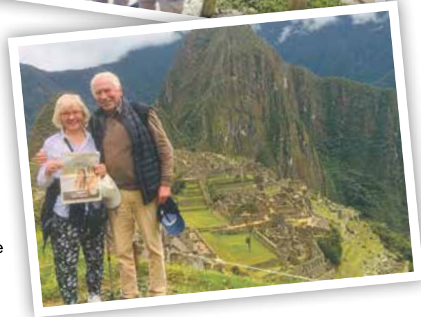
Die Eheleute Freisens aus Bad Laasphe besuchten Peru.