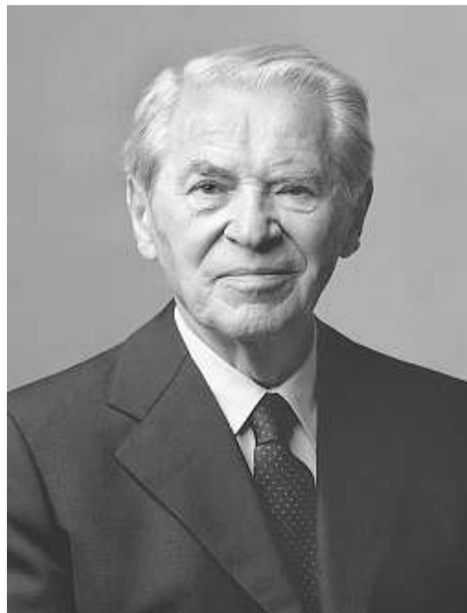
Werner Otto gehörte zu den großen deutschen Wirtschaftspionieren.

Weitere Informationen über Werner Otto: www.werner-otto.info