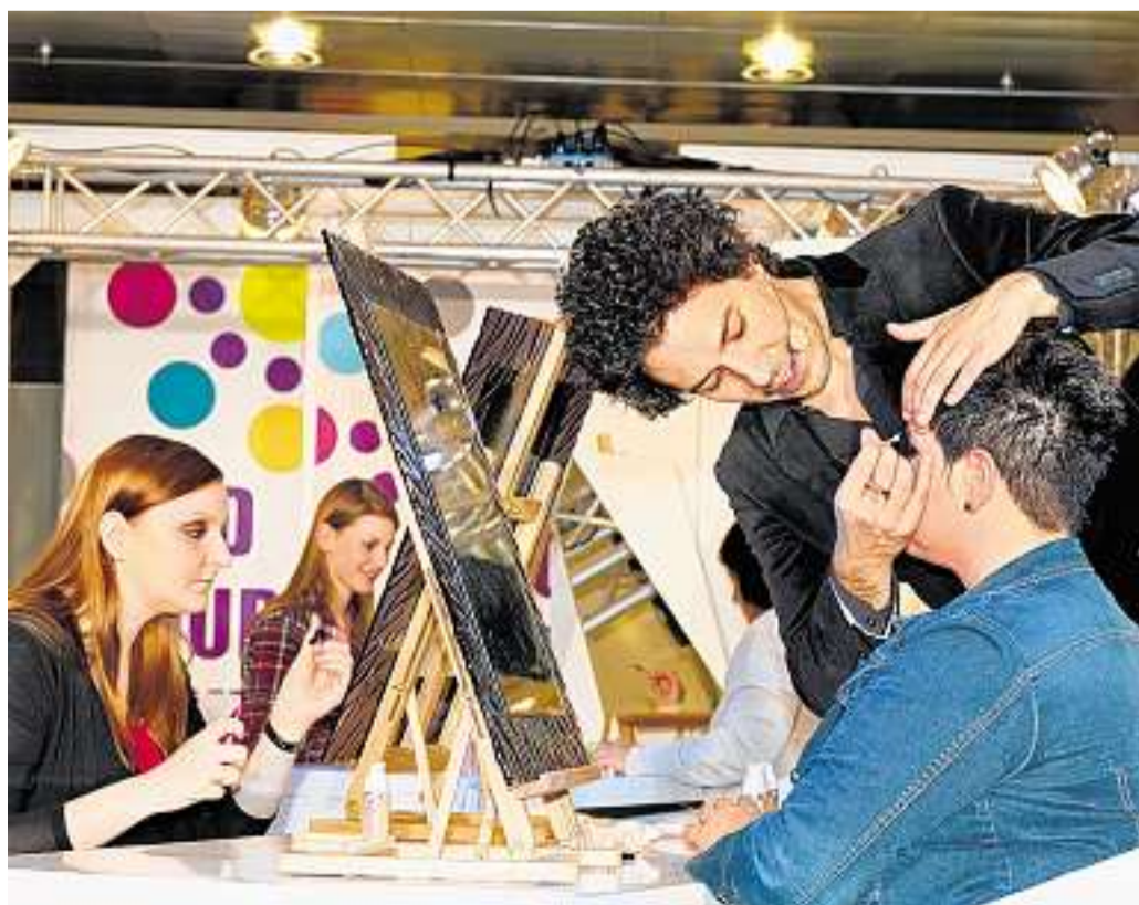
Auch 2012 wird die Aktion „Find your Style“ in der City-Galerie wieder für Furore sorgen.